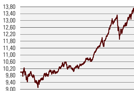
Fondiosaku puhasväärtus juuni 2002 - veebruar 2007