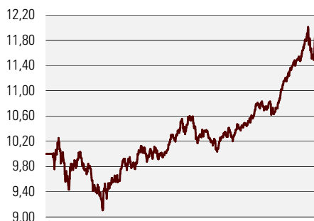
Fondiosaku puhasväärtus juuni 2002 - november 2005