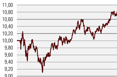
Fondiosaku puhasväärtus juuni 2002 - aprill 2005