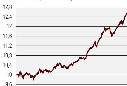
Fondiosaku puhasväärtus juuni 2002 - veebruar 2007