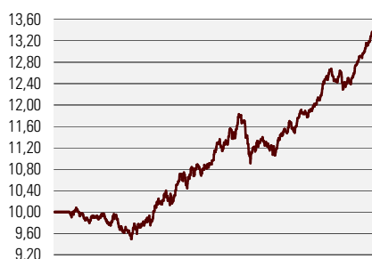
Fondiosaku puhasväärtus juuni 2002 - august 2005