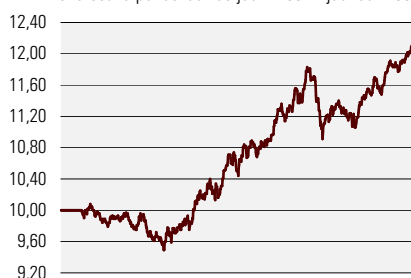
Fondiosaku puhasväärtus juuni 2002 - jaanuar 2005