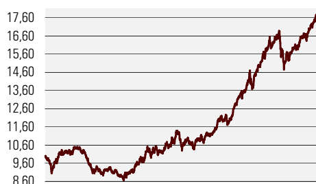
Fondiosaku puhasväärtus august 2001 - märts 2007