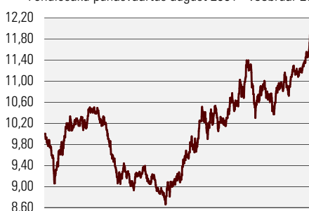
Fondiosaku puhasväärtus august 2001 - veebruar 2005