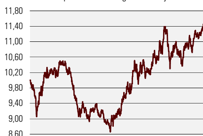
Fondiosaku puhasväärtus august 2001 - jaanuar 2005