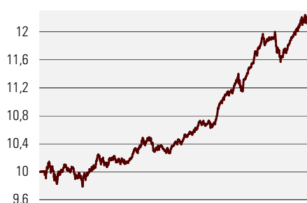
Fondiosaku puhasväärtus juuni 2002 - detsember 2006