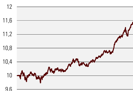
Fondiosaku puhasväärtus juuni 2002 - jaanuar 2006