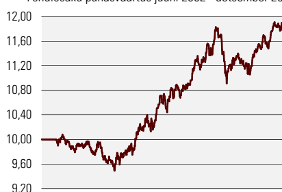
Fondiosaku puhasväärtus juuni 2002 - detsember 2004