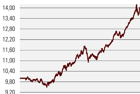
Fondiosaku puhasväärtus juuni 2002 - november 2005